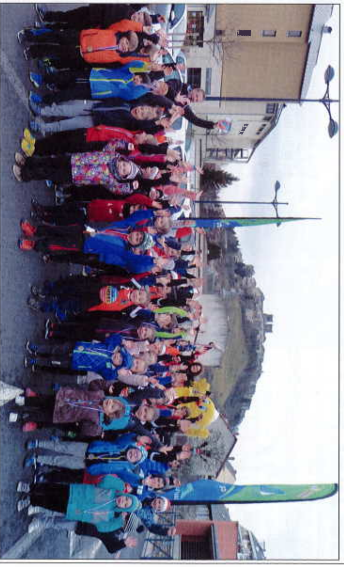
Les jeunes participants de la Corrida, tous ravis de courir pour le plaisir.