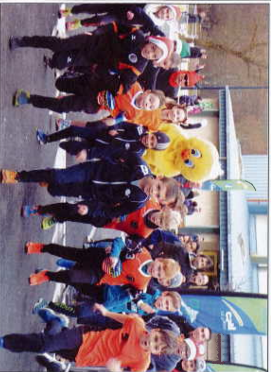
Le départ de l'une des courses pour enfants de la Corrida de Noël.

Si la magie de Noël a débuté bien avant les vacances à Saint-Flour, elle s'est intensifiée ces 15 derniers jours. Après le marché de Noël ou le spectacle son et lumière Place d'Armes, qui ont tous deux remporté un grand succès, les vacances ont démarré sur les chapeaux de roues. Le 22 décembre, une patinoire éphémère a été installée sur la Place d'Armes, à l'initiative de l'association des commerçants et avec le soutien des clubs sportifs et de la municipalité. Elle a connu un très beau succès, les patineurs ont été très nombreux à s'adonner aux joies de la glisse et à déguster une boisson chaude.