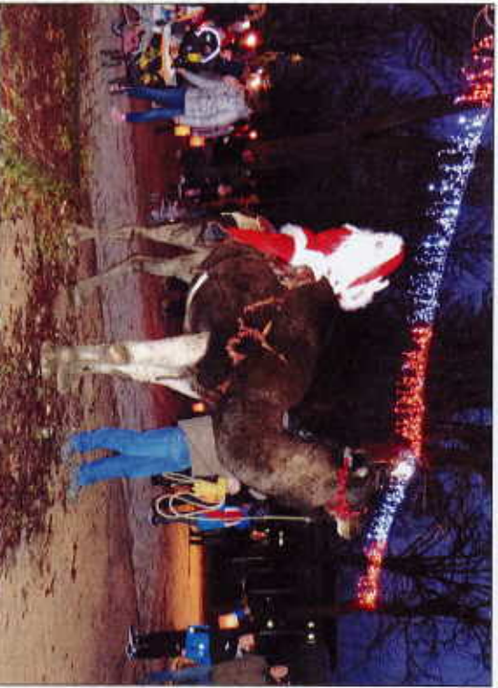
Lors de la retraite aux flambeaux, le Père Noël a abandonné ses rennes pour un tour à dos de dromadaire laineux.

Un peu plus tard le même jour, mais en ville-haute cette fois, la retraite aux flambeaux était animée par le groupe « Les Chamalots », qui jouait des airs de fête en accompagnant le cortège jusqu'à la Place d'Armes. Le Père Noël, qui avait un emploi du temps très chargé, a participé à tous ces événements.